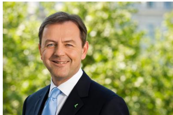
DI Niki Berlakovich Landwirtschafts- und Umweltminister

Radtouren haben in Österreich eine große Tradition, ebenso wie gutes Essen und Trinken. Solche Touren eignen sich perfekt, um Sehenswürdigkeiten und Besonderheiten der Regionen erlebbar zu machen. Mit dieser neuen Partnerschaft laden wir dazu ein, die Genuss Regionen des Landes zu entdecken und die regionalen Köstlichkeiten zu genießen.